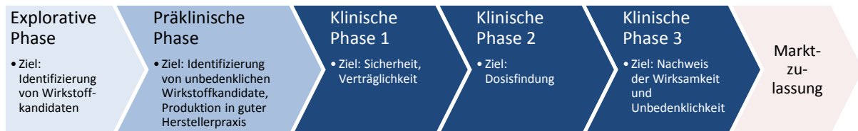
Abbildung 1: Übersicht über Phasen der Impfstoff-Entwicklung

Nach Herstellung eines möglichen Impfstoffkandidaten im Forschungslabor wird in ersten Tier- und Zellkulturexperimenten überprüft, ob dieser neben der Verträglichkeit geeignet ist, eine Schutzwirkung gegenüber dem Zielerreger bzw. der von diesem ausgelösten Infektionskrankheit, sofern hierzu ein Tiermodell existiert, hervorzurufen. Anschließend werden toxikologische und pharmakologische Eigenschaften in verschiedenen Tiermodellen überprüft. Erst wenn es keine Bedenken hinsichtlich der Anwendung beim Menschen gibt, wird in einer ersten klinischen Prüfung die Unbedenklichkeit an Freiwilligen, gesunden Erwachsenen untersucht (Phase 1). In den nachfolgenden klinischen Studienphasen wird die optimale Dosierung und das Impfschema in einer größeren Anzahl von Freiwilligen (mehrere hundert) überprüft (Phase 2) und anschließend in einer großen randomisierten kontrollierten klinischen Studie (Phase 3) mit mehreren tausenden Freiwilligen verschiedener Altersgruppen die Wirksamkeit und das Nebenwirkungsprofil des Impfstoffs ermittelt.